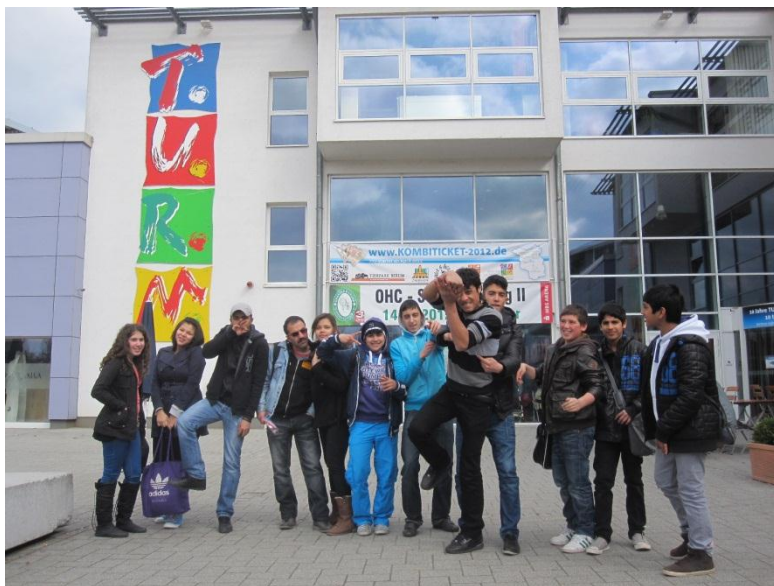
Ausflug zum T.U.R.M. im April