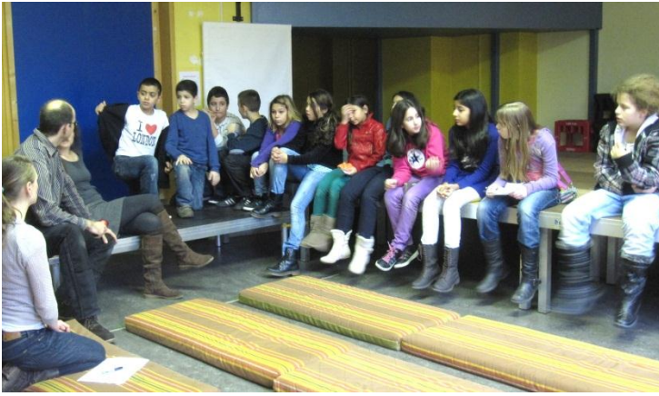
Theateraufführung „Die Klassenfahrt“