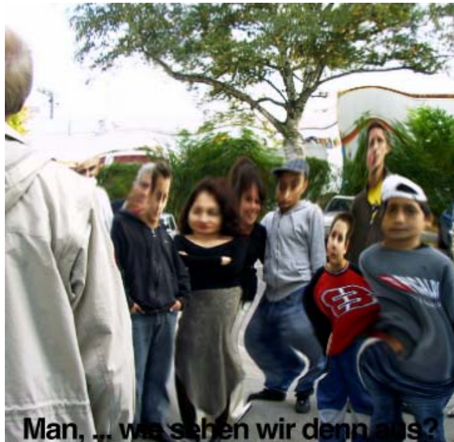
Man, ... was sehen wir denn aus?