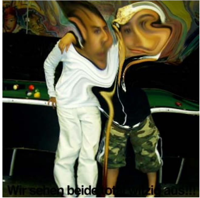
Wir sehen beide total witzig aus!!!