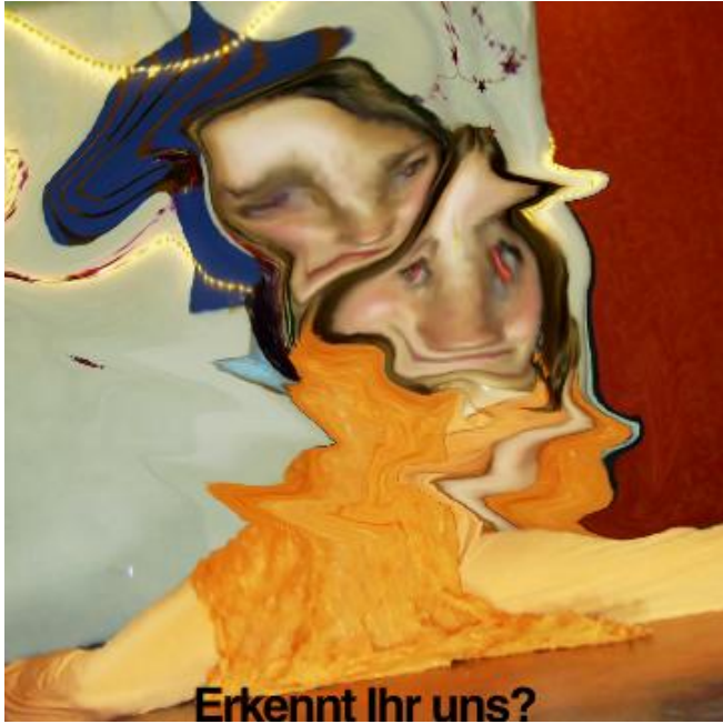
Erkennt Ihr uns?