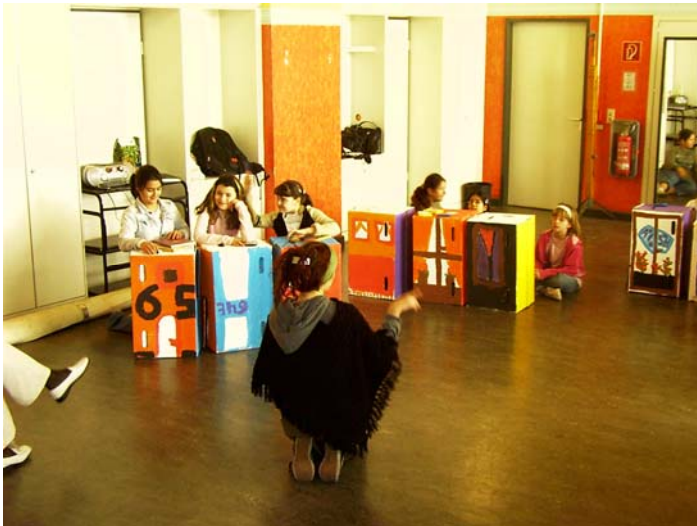
Probearbeiten in der Lynar