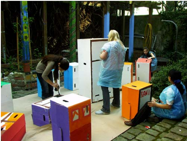
Kulissenbau im hinteren Hof